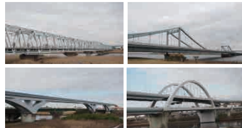
荒川下流域で見られる様々な橋

橋を理解するためには、種類、名称、構造的な特徴などの橋の基本情報を知ることが大切です。ここでは、他の人にも教えたくなるような、橋のキホンについて紹介します。