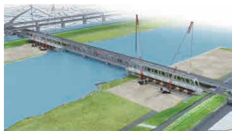
京成本線荒川橋梁の架替工事イメージ

令和5年2月に起工式を開催した「京成本線荒川橋梁架替事業」など、荒川の橋にかかわる最新情報を紹介します。