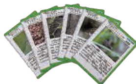
荒川のいきものカード