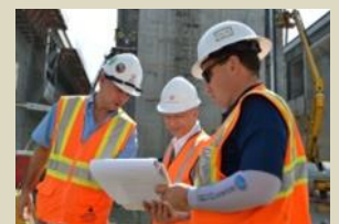
パナマ運河を視察する講師(中央)