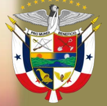
パナマ共和国紋章