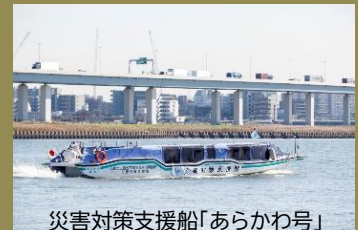
災害対策支援船「あらかわ号」