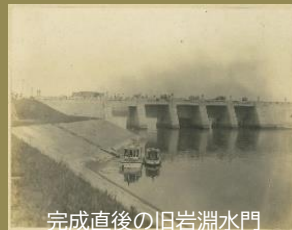
完成直後の旧岩淵水門