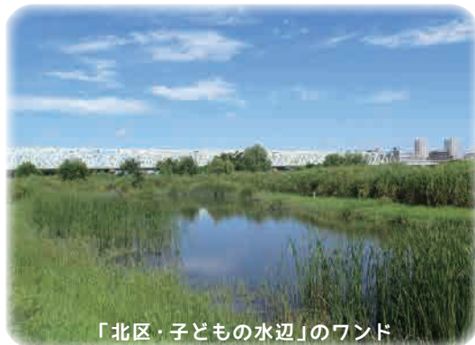
「北区・子どもの水辺」のワンド