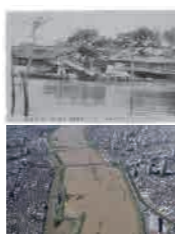
写真画像 (アモアHP参照)