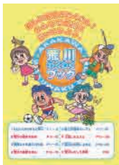
荒川わくわくブック