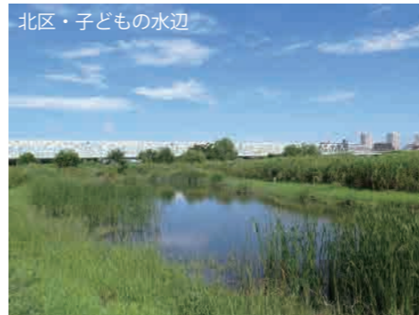
荒川知水資料館より徒歩20分 南北線「赤羽岩淵駅」より徒歩15分 JR「赤羽駅」より徒歩20分

荒川の河川敷にある「北区・子どもの水辺」には、水辺や草はらなどの豊かな自然があり、植物や鳥などの観察のほか、魚やカニ、昆虫などの採集を体験することができます。