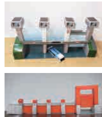
パーパークラフト