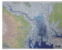
立体模型 (各学校につき1部提供)