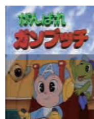
がんばれガンブッチ DVD