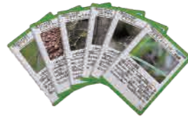
生きものカードブック