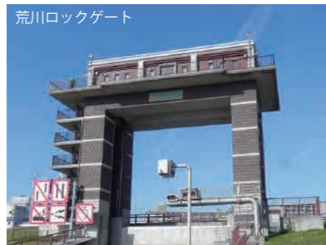
都営新宿線「東大島駅」小松川口より徒歩10分 ※専用駐車場はありません。公共交通機関をご利用ください。 〒132-0034 東京都江戸川区小松川1地先

近隣に「江東区中川船番所資料館」があります。荒川ロックゲートから徒歩12分です。